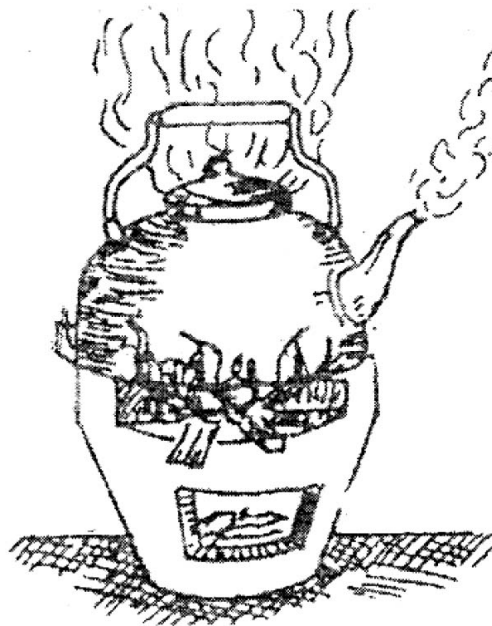
Hình 3. Đun sôi nước để uống