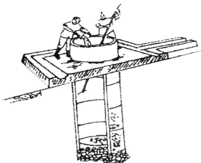
Hình 4. Khử trùng giếng khơi

1.2. Giếng khoan: Bơm hết nước đục và bơm tiếp 15 phút nữa bỏ nước đi sau đó có thể sử dụng được. Cần chú ý làm vệ sinh bơm, sàn giếng.